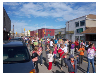
la Fête de la culture à Flin Flon

- Onalee Groves, agent culturel au développement, service de la Culture, ville de Barrie (Ontario)